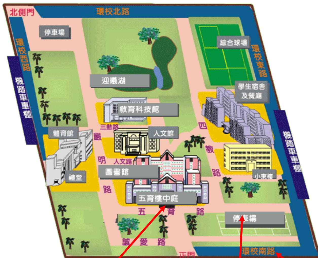
國立屏東大學民生校區平面圖 (地址:屏東市民生路 4-18 號)